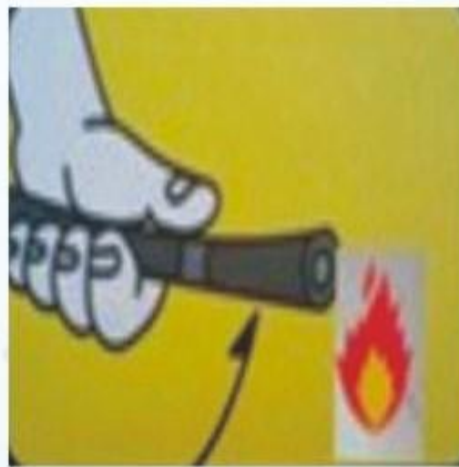
握住皮管，将喷嘴对准火苗根部