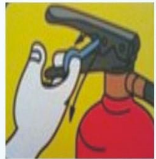
用力握下手压柄喷射

注：除酸碱式灭火器外，其他灭火器使用时不能颠倒，也不能横卧，否则灭火剂不会喷出。